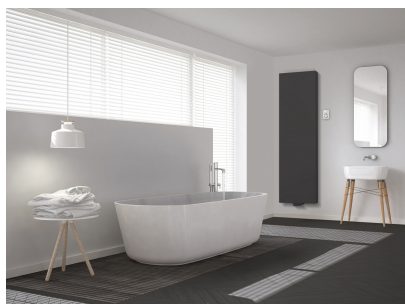
TINOS 325 mm